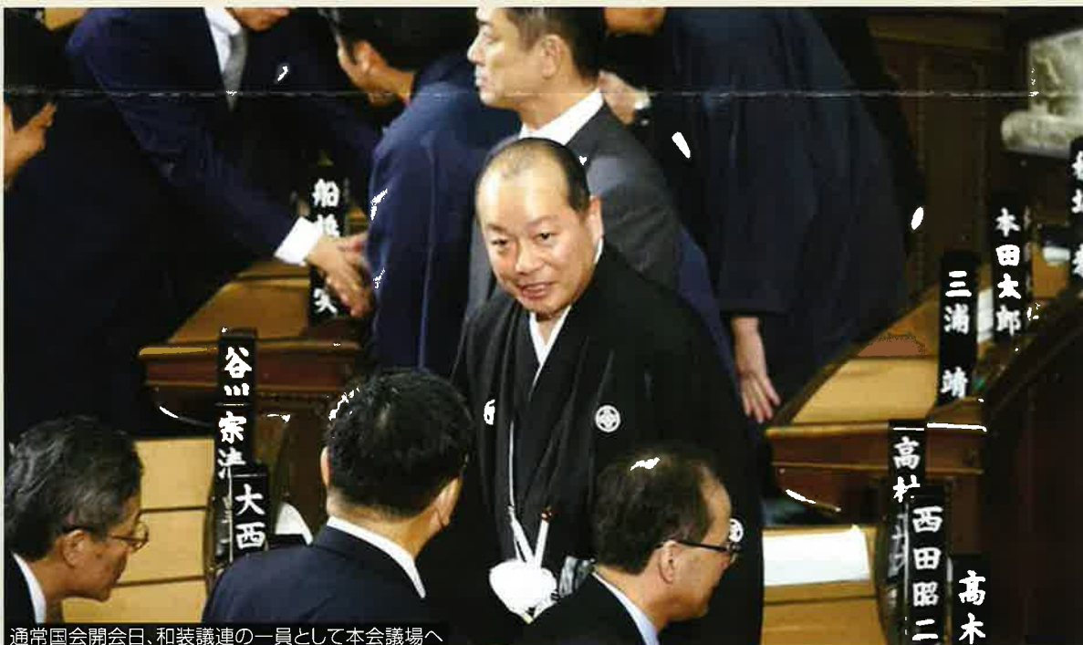
通常国会開会日、和装議連の一員として本会議場へ

43 分の長時間演説。国会では、不信任案提出の際の趣旨弁明には、時間制限がないルールになっていますが、適切な時間制限の必要性を感じました。