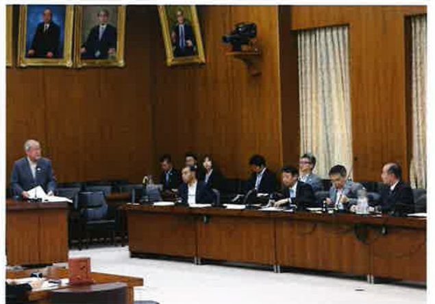
内閣委員会にて全世代型社会保障のありかたについて質問 文部科学委員会にてデジタル教科書について質問 文部科学委員会にて2020年オリ・パラ準備状況について質問