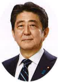
安倍 晋三 総裁

令和に入って2年目となる今年、わが党は政権政党として、引き続き山積する内外の諸課題に真正面から向き合い、新しい時代を、皆さまとともに切り拓いてまいります。