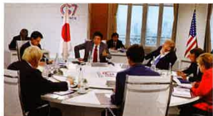
G7フランス・ビアリッツサミット

わが国は戦後一貫して平和国家として歩んできましたが、平和は与えられるものではなく、自らつくり出す努力をしなければなりません。平和憲法のおかげで平和だったと主張される方がいますが、それは事実誤認です。米国との同盟関係が機能し、運にも恵まれたことが平和を維持できた大きな要因です。