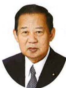
二階 俊博 幹事長

その道しるべとなるのが憲法です。国会議論を通じ皆さまへの責任を果たしていく決意です。