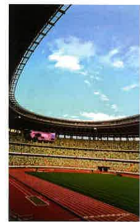
完成した新国立競技場

■まずは補正予算、そして令和2年度予算の早期成立を目指す 先般閣議決定された令和元年度補正予算案は約4兆3000億円。防災・減災・国土強靱化、各種経済対策等に中小企業生産性革命の推進・キャッシュレス・ポイント還元事業等、子供子育て・教育の充実、ICT教育推進のためのGIGAスクール構想の実現、スポーツの裾野を広げる取り組みとラグビーW杯のレガシーづくり…など、大型補正予算の編成となりました。